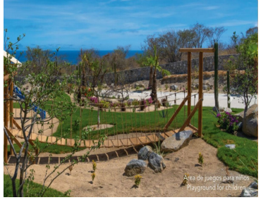
Área de juegos para niños Playground for children