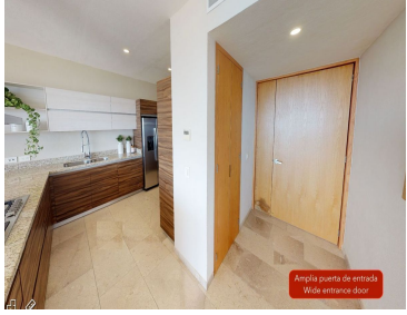
Amplia puerta de entrada Wide entrance door