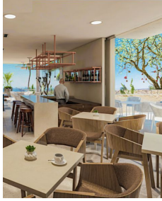
Zona de grill y comedores BBQ area and dining