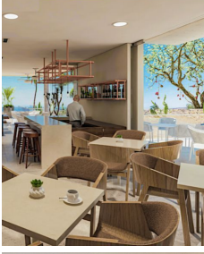
Zona de grill y comedores BBQ area and dining