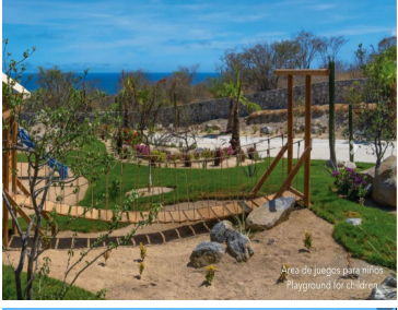
Área de juegos para niños Playground for children