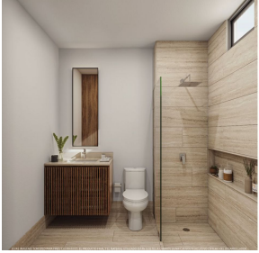
Baños con cubierta de mármol Bathrooms with marble finishes