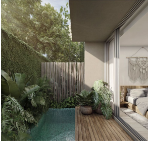
Casita con alberca privada Private pool casita