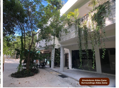
Alrededores Aldea Zama Surroundings Aldea Zama