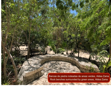
Bancos de piedra rodeados de áreas verdes. Aldea Zama Rock benches surrounded by green areas. Aldea Zama