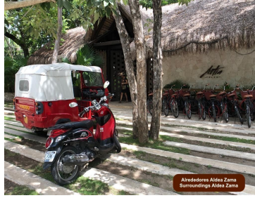
Alrededores Aldea Zama Surroundings Aldea Zama