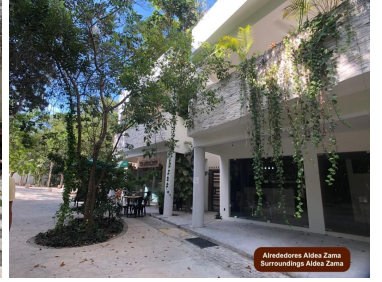
Alrededores Aldea Zama Surroundings Aldea Zama