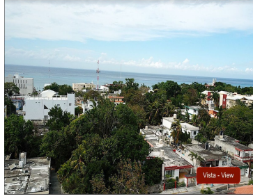
Vista - View