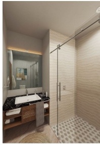
Baño con vidrio templado Bathroom with tempered glass