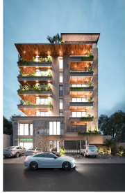
Fachada de noche Facade by night