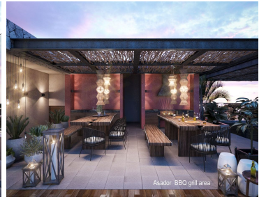
Asador: BBQ grill area