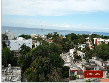
Vista - View