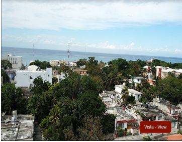
Vista - View