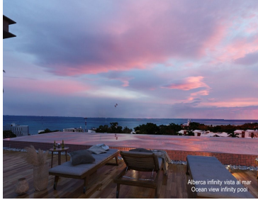
Aberca infinity vista al mar Ocean View infinity pool