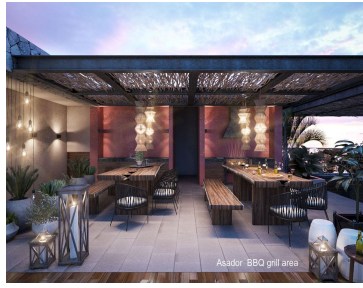
Asador BBQ grill area