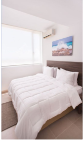
Ventanas amplias, recamaras iluminadas Wide windows in bedrooms, natural light