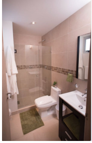
Baños con cubierta cerámica y cristal templado Bathroom with ceramic cover and tempered glass