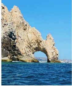
El Arco Cabo San Lucas The arch