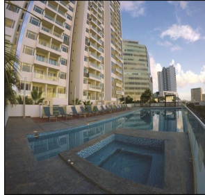
Alberca con jacuzzi Swimming pool & jacuzzi