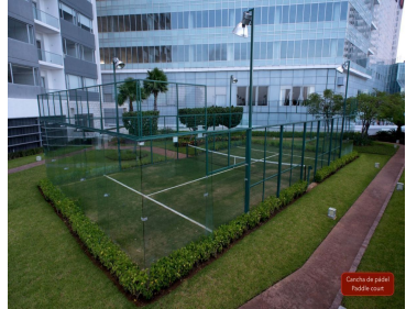
Centro de pádel Pádel court