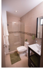
Baños con cubierta ceramica y cristal templado Bathroom with ceramic cover and tempered glass