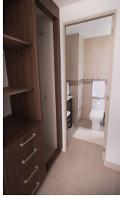
Recamara principal con closet y baño privado Main bedroom with closet and private bathroom