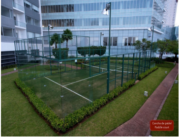
Centro de pádel Pádel court