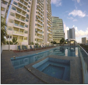
Alberca con jacuzzi Swimming pool & jacuzzi