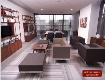
Centro de negocios Business center