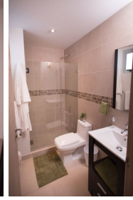
Baños con cubierta cerámica y cristal templado Bathroom with ceramic cover and tempered glass