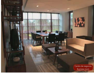
Centro de negocios Business center