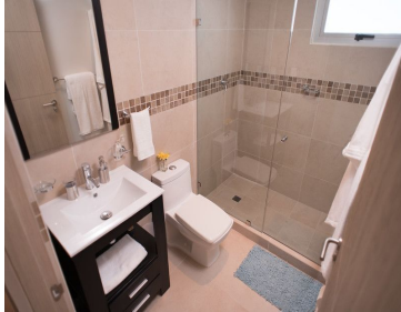
Main bedroom with closet and private bathroom