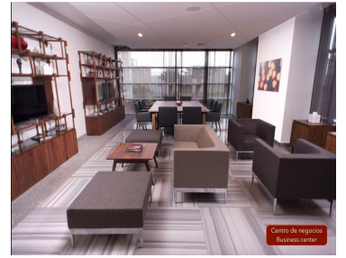
Centro de negocios Business center