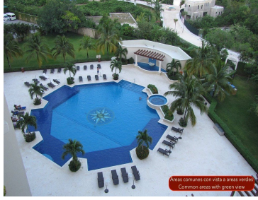
Áreas comunes con vista a áreas verdes Comedor áreas with green view