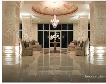
Recepción - Lobby