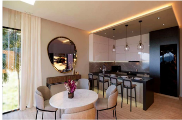
Cocina con diseño abierto Open design kitchen