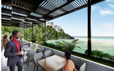
Terraza con vista al mar Ocean view terrace