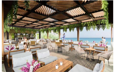
Terraza con vista al mar Ocean view terrace