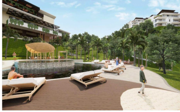
Club de playa Beach club