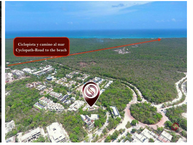
Ciclista y camino al mar Cyclopath-Road to the beach