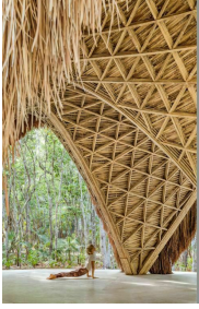
Palapa de yoga con diseño unico Yoga palapa with unique design