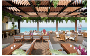
Terraza con semi sombra y vista al mar Ocean view semi shaded terrace