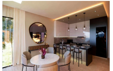
Cocina con diseño abierto Open design kitchen