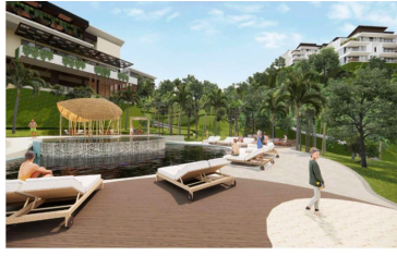
Club de playa Beach club