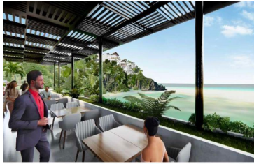
Terraza con vista al mar Ocean view terrace