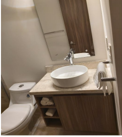
Baño con todos los accesorios Bathroom with all accessories