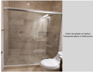
Vidrio templado en baños Tempered glass in bathrooms