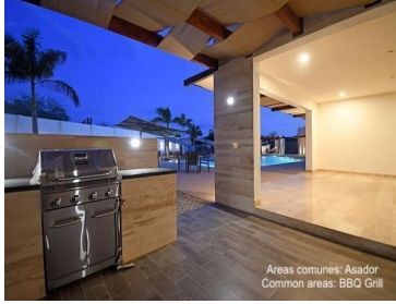
Areas comunes: Asador Common areas: BBQ Grill