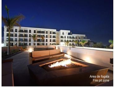
Area de fogata Fire pit zone