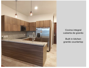
Cocina integral cubierta de granito Built in kitchen granite countertop