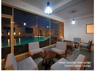
Areas comunes: Area lounge Common areas: Lounge