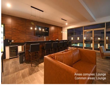
Areas comunes: Lounge Common areas: Lounge