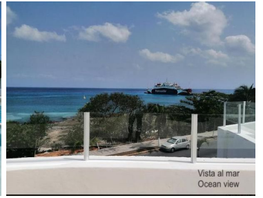
Vista al mar Ocean view