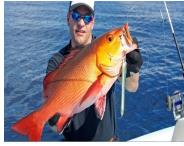
Gold Fish Pez Dorado