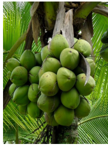
Plantacion de cocos (Alrededor de 12,000 cocos cada 3 meses) Coconut orchard (around 12 thousand coconuts every 3 months)