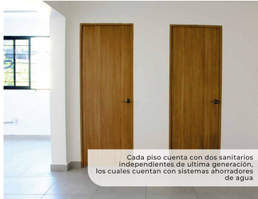
Cada piso cuenta con dos sanitarios independientes de última generación, los cuales cuentan con sistemas ahorradores de agua