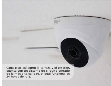
Cada piso, así como la terraza y el exterior, cuenta con un sistema de circuito cerrado de la más alta calidad, el cual funciona las 24 horas del día.