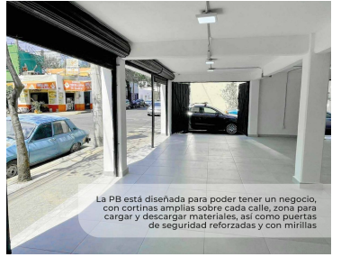
La PB está diseñada para poder tener un negocio, con cortinas amplias sobre cada calle, zona para cargar y descargar materiales, así como puertas de seguridad reforzadas y con mirillas