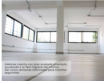
Además cuenta con piso acabado premium, ayudando a la fácil higiene del mismo. Así como ventanas reforzadas para máxima seguridad