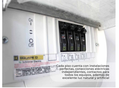
Cada piso cuenta con instalaciones perfectas, conexiones eléctricas independientes, contactos para todos los equipos, además de excelente luz natural y artificial