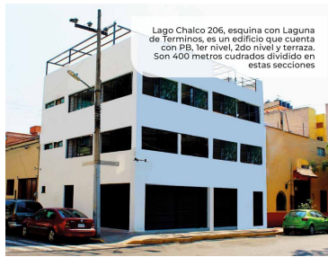
Lago Chalco 206, esquina con Laguna de Terminos, es un edificio que cuenta con PB, 1er nivel, 2do nivel y terraza. Son 400 metros cuadrados dividido en estas secciones