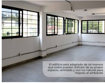
El edificio está adaptado de tal manera que todos puedan disfrutar de su propio espacio, ventilado y con luz natural para mejorar el ambiente