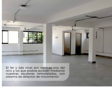
El 1er y 2do nivel son réplicas uno del otro a los que podrás acceder mediante nuestras escaleras remodeladas, con sistema de detector de movimiento