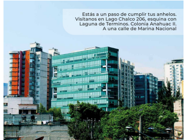
Estás a un paso de cumplir tus anhelos. Visítanos en Lago Chalco 206, esquina con Laguna de Terminos, Colonia Anáhuac II. A una calle de Marina Nacional