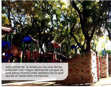
Actualmente, la Anáhuac es una de las colonias con mayor demanda ya que es una zona mucho más residencial lo que ayuda al desarrollo comercial.