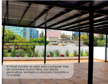
El Roof Garden es apto para cualquier tipo de actividad al aire libre, con barda perimetral, techado y una vista increíble a la ciudad.