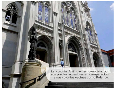
La colonia Anáhuac es conocida por sus precios aceptables en comparación a sus colonias vecinas como Polanco.