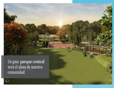
Un gran parque central será el alma de nuestra comunidad