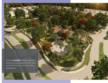
Los terrenos construidos con comodidad y seguridad en una zona de alto nivel de seguridad y confort.