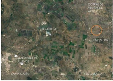
Fig. 01 Vista satelital del terreno