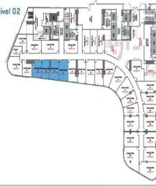
Planta Medical Hub - Nivel 02