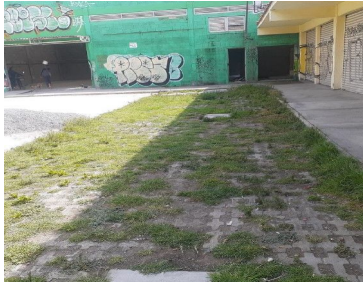
AREA DONDE SE ENCUENTRA LA CISTERNA