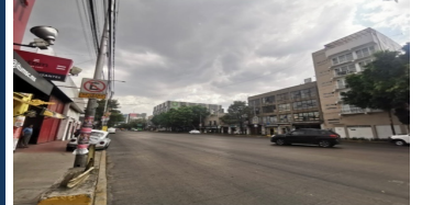
FOTOS DEL ÁREA