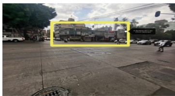
FACHADA CON DOS FRENTES DE 19MTS. SOBRE AV. REVOLUCIÓN Y CALLE 10.