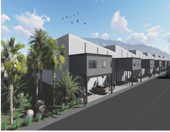
BOVEDAS | Tipo A 430 m 2