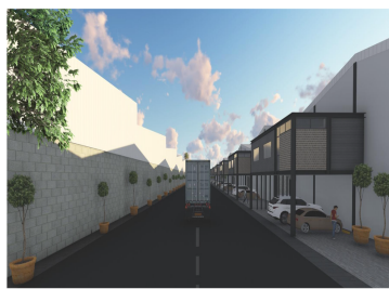
BOVEDAS | Circulaciones