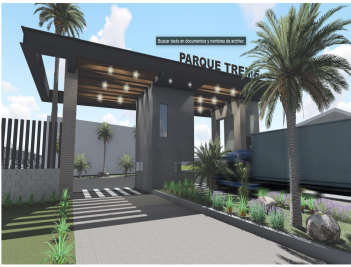
CADETA DE ACCESO | Futuro y presente con acceso controlado