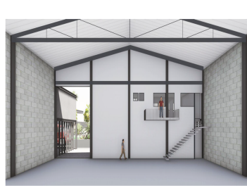
VISTA INTERIOR | Buen valor desde las oficinas hacia el área de trabajo