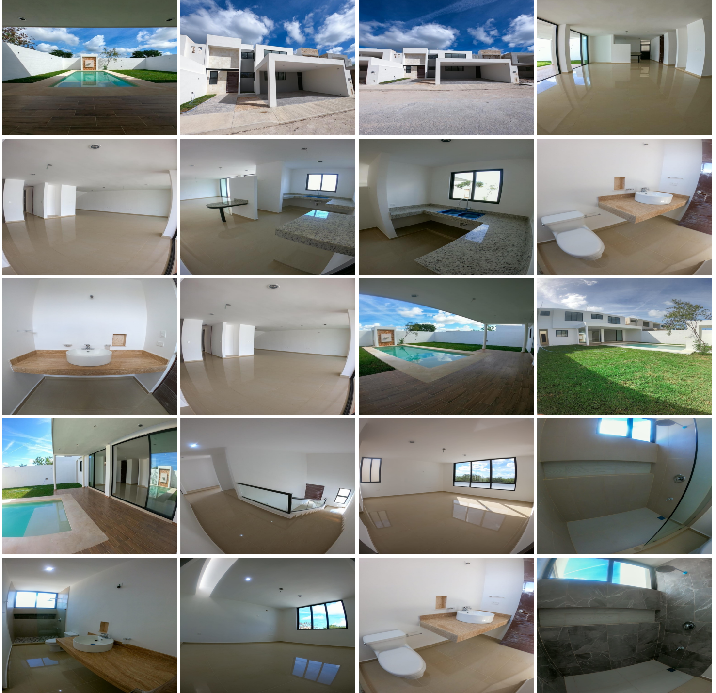
PLANTA BAJA MODELO 4