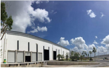
- IMAGEN EXTERIOR -