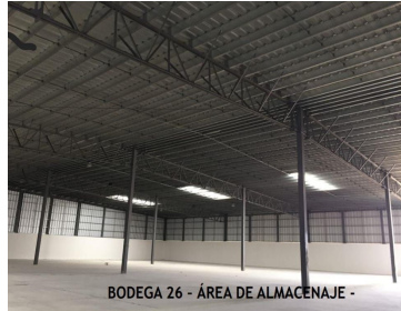
BODEGA 26 - ÁREA DE ALMACENAJE -