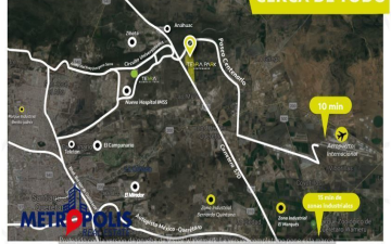
EN PLENO CORREDOR INDUSTRIAL DEL BAJO