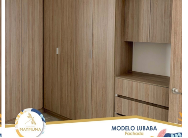
MODELO LUBABA Facturado