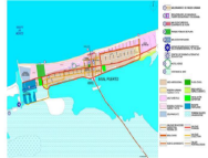
Figura 12. ESTRUCTURA URBANA TURÍSTICA SISAL

También se contempla la construcción de un boulevard en la calle 10, desde el Club de Pesca hasta próximo con el Muelle.