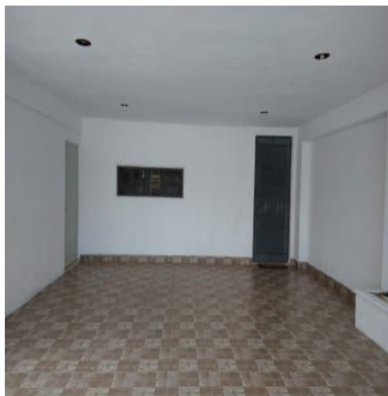
GARAGE PARA DOS AUTOS